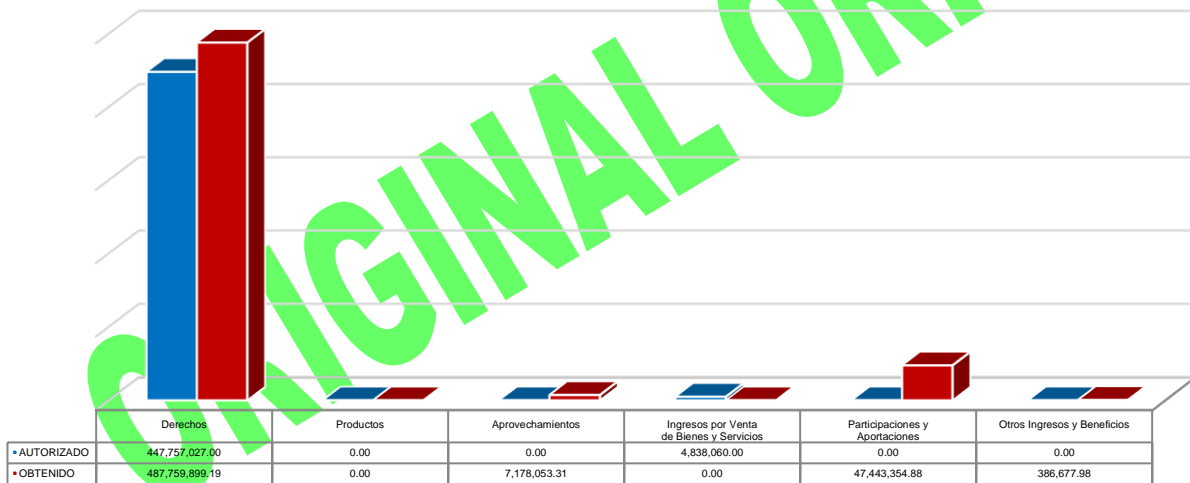
Gráfico 1. Ingresos